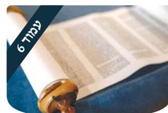
עמוד 6 הניצוץ היהודי לא מאוחר מדי