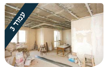
עמוד 3 הרב משה לנדאו השיפוץ