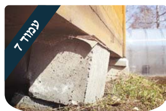
עמוד 7 ערכים מאחורי הקלעים לקרב קרובים ורחוקים