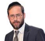
הרב משה לנדא