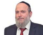
הרב דניאל נשיאי