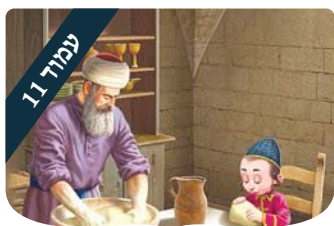
עמוד 11 ערכים לילדים מצא את ההבדלים

הידיעה שמעשים רוחניים משפיעים על המציאות הגשמית היא פלא גדול, לכן מדגישה אותה התורה