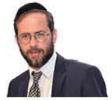
הרב משה לנדא