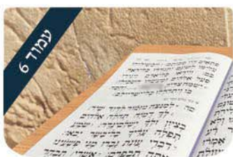
עמוד 6 ממ"ד של תהילים הניצוץ היהודי