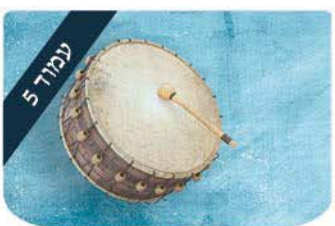
עמוד 5 שירה בגלות הרב דוד ברורמן