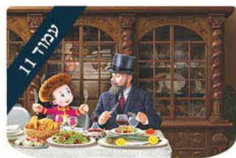
עמוד 11 מציא את ההבדלים ערכים לילדים

טבעי לאדם שיחוש כי אחרי הנהגה ממושכת ראוי לו לקבל כפרס את המשך ההנהגה