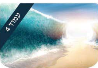
עמוד 4 אתם תחרישון-דיענד או אידיאל? הרב צביאל בן צור