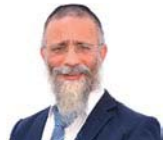
הרב מיכאל לסרי