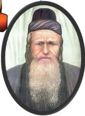
הילולת רבנו הצדיק רבי אבא שלום שבזי זצ"ל זיע"א (ט' שבט)

הצדיק מארי אבא שלום שבזי זצ"ל- נולד בכפר נגיד אלוליד שבתימן בשנת ה'שע"ט . בהיות כבן 15 נתייתם מאביו ולאחר שנים מועטת התייתם אף מאמו ונאלץ ( לקחת על עצמו את עול כלכלת משפחתו. במהלך נדודיו הגיע לצנעא ושם למד בישיבה של חכמי העיר. בהמשך עבר לשבו ולאחר מכן לתעוז, שם בנה בית כנסת ומקווה והתפרנס מאריגת טליתות. בשנת ה'תל"ט גזר האימאם 'אלמהד בן חסן אלקאסי' שמד על יהודי תימן, אך לבסוף הומרה הגזירה בגירוש. במסגרתה גלו למדבר מוזע. כל חייו חי חיי עוני ומחסור. השקיע את כל כולו בעסק התורה הקדושה ונעשה בקי בה. גאון בנגלה ובנסתר. מלומד בניסים. בעל רוח-הקודש. רבים סיפורי המופתים וישועת שנעשו על ידו. ידע את יום פטירתו והכין את תכריכיו וכל הדרוש לקבורתו. נפטר סמוך לחשכה מסופר כי עמדה השמש לשני תלמידיו בשביל שיספיקו לקברו לפני השבת. נפטר בערב שבת ט' בשבט ה'ת". ציונו נמצא על צלע ההר בכפר אל-מגרבה (תעוז). חי כ 91- שנים. עד היום ציונו הפך למוקד עליה לרגל ורבים נושעו שם. שמו הונצח בשמותיהם של בתי כנסת רבים של העדה התימנית וכן ברחובות ובשכונות הנושאים את שמו. ת.נ.צ.ב.ה. וזכותו העצומה תגן עלינו אמן.