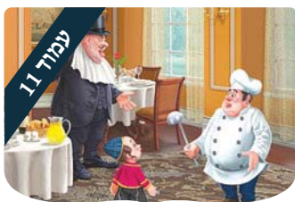
עמוד 11 מציאת ההבדלים ערכים לילדים

מקורות עתיקים מצביעים על המומחיות של המצרים בהכנת לחם. המצרי עבר תהליך התפחה מיוחד