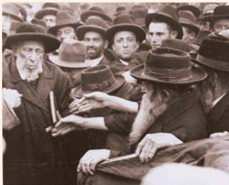
הרה"ק האדמו"ר הראשון לחסידות ספינקא, רבי יצחק אייזיק ווייס בעל "חקל יצחק" הי"ד עם חסידיו

הרה"ק רבי יצחק אייזיק ווייס המכונה על שם ספרו "חקל יצחק", בנו של הרה"ק רבי יוסף מאיר, האדמו"ר הראשון לחסידות ספינקא. נולד בשנת תרל"ה, בעיירה ספינקא בחבל מרמרוש, אז בממלכה האוסטרו הונגרית. נודע כרב ופוסק וכתב שו"ת בכל חלקי השולחן ערוך. התפרסם מגיל צעיר בכשרונותיו ובהתמדתו בתורה, בנגלה ובנסתר, וכבר אז החליף שאלות ותשובות עם גדולי הדור, בהם המהרש"ם מבערזאן, רבי יצחק אלחנן ספקטור מקובנא ורבי אברהם פאלאג'י, מרא דאתרא באיזמיר. חסידות ספינקא, הפכה בימיו לאחת משלוש החצרות הגדולות בהונגריה. היו לו אלפי חסידים במרמרוש, בטרנסילבניה ובכל רחבי הארץ.