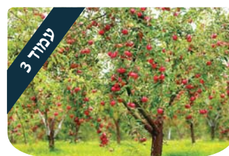
עמוד 3 העץ הנדיב הרב משה לנדאו