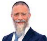
הרב מיכאל לסרי