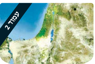
עמוד 2 הרב אהרון לוי משחק הכיסאות