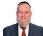
הרב זוד ברוורמן