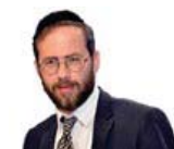
הרב משה לנדאו