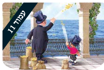
עמוד 11 מציאת ההבדלים ערכים לילדים

ולמרות זאת, כשיוסף מתגלה לאחיו, הם מגיבים בתדהמה מוחלטת ובחוסר אימון מוחלט