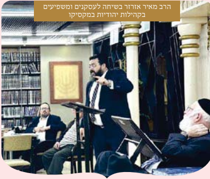
הרב מאיר אזור ביחה לעסקנים ומשפיעים בקהילות יהודיות במקסיקו

פעילות ענפה של 'ערכים' במקסיקו להכנת תשתית לסמינר עבור יהודים מקומיים שיתקיים בחודשים הקרובים ולקראת הפעילות בקרב רבבות התרמילאים הישראלים הנוהרים לחבל קנקון