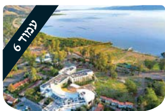
עמוד 6 הניצוץ היהודי הניצוץ ונפגע