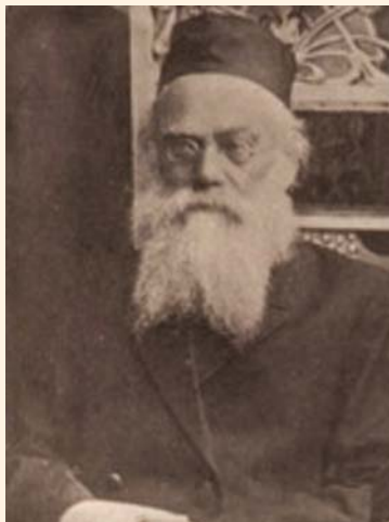
הגאון הרב שמעון שקופ זצ"ל - ראש ישיבת גרודנה

"מה ששמר עלי בכל אותה תקופה קשה, מה שלא נתנני להפוך עורף ליהדותי, היו אותן שתי קושיות, שיצאו מפיו של אותו צדיק. הרב שקופ שמר על יהדותי, ולא עוד שעד היום משתדל אני ליישם את מה שלמדתי ממנו. להחיות נפשו של אורח ולהקל את סבלי נדודיו בכך..."