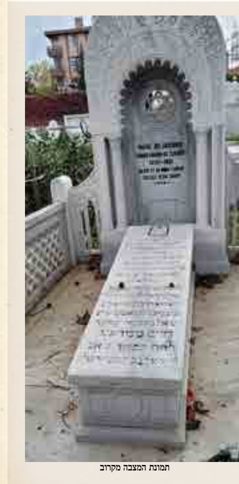
תמונת המצבה מקרוב