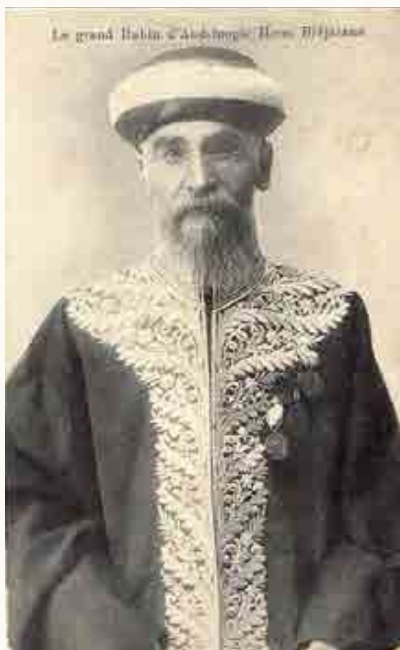
רבי חיים ביוראנו עם גלימת החכם באשי כרב ראשי בטורקיה

הרוחות ולנהל בחכמה ובזהירות רבה את אנייתו המטורפת בגלי ים סוערים.