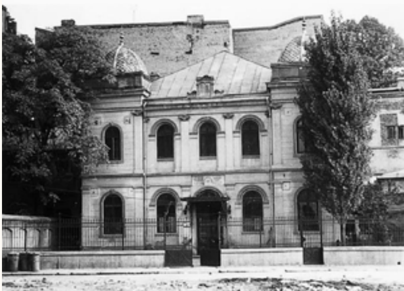
בית הכנסת 'הספרדי הקטן' בבוקרשט, נהרס בשנת תשמ"ה (85) במסגרת התכנון מחדש של העיר בבוקרשט על ידי הרודן צ'אוצ'שקו