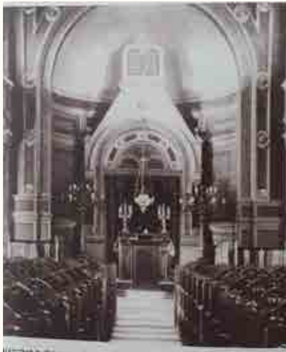
מראה פנימי של בית הכנסת הספרדי 'קהל גרנדה' לקהילת ספרד בבוקרשט