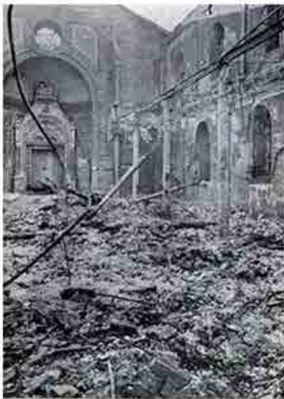
מראה בית הכנסת לאחר שנבזז ונשרף על ידי הלגיונרים והאספוסף במהלך מרד הלגיונרים ופרעות בוקרשט בכ"ב טבת תש"א (21 בינואר 1941)