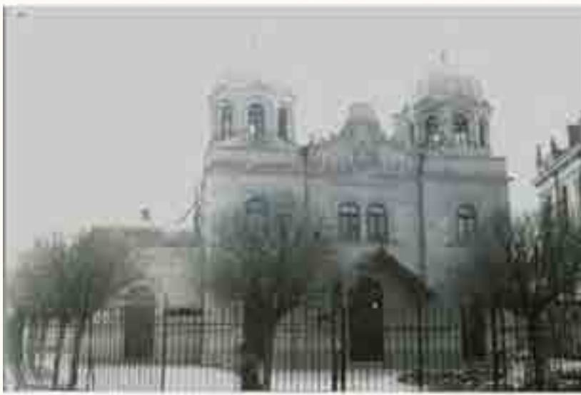
בית הכנסת הספרדי 'קהל גראנדה' בבוקרשט המכונה גם 'קהל קדוש גדול' בשכונת וואקארשט ברחוב נגרו וודה 12. הבניין נהרס ואינו קיים כיום, בעולם היהודי הספרדי היו עוד בתי כנסת שנועדו בשם 'קהל גראנדה' כמו בית הכנסת יוחנן בן זכאי בירושלים, ובית הכנסת קהל גראנדה באי ורוס

ברומניה, כמו בשאר ארצות הבלקן, חיו יהודים מן התקופה היותר עתיקה, בכל הארצות שבאירופה הדרומית מזרחית - ורומניה בכלל - נמצאו כתבות יהודיות לרוב מימי שלטון רומא. מלבד ראיות אלו, הלא ידועה עדותו של ידידיה האלכסנדרוני שבמאה הראשונה לפני סה"נ, היו נמצאים יהודים אף במקומות הרחוקים של הפונטוס (הים השחור). הישוב היהודי בארצות הללו כמעט שלא נפסק במשך הזמן, אע"פ שתעודות אמיתיות על דבר זה לא נשארו לנו כי אם מאחרית ימי הבינים, עת התפשט כבוש הטורקים בחצי האי