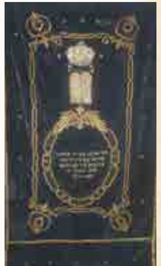
פוכת בית המדרש מלבי"ם משנת תרס"ו