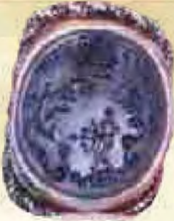
חותם רבי אברהם המלאך הקטן, עליה חרוט:

והלכה להאדון העיר, להלשין על בני העיר שרודפים אותה, בהוסיפה שהדבר נעשה וודאי על פי פקודת רבם, הרה"ק רבי אברהם, אשר כל בני העיר שומעים לקולו. על כן בקשתה, שהאדון למשרתיו, להביא את הרה"ק רבי אברהם, למותחו על העמוד המיועד להלקות את המורדים באדון, לנקמתה בו ולהלקותו. המרשעת שידעה שאם ירצה האדון לבצע זממו באמצע יעורר הדבר מהומה גדולה וכל אנשי העיר יעמדו נגדו ולא יניחו לנגוע בו. על כן יעצה לאדון, שמשרתיו יבואו לבית הרב, השכם קודם אור היום, בעת אשר אנשי העיר ישנים, ואז יעלה בידו לעשות בו נקם. משרתי האדון מלאו בקשתה ובאו אל בית הרב קודם אור היום ויתנוהו בבית הסוהר, אך גם עצתה זו לא עמדה לה, כי הדבר נודע תיכף לאנשי העיר, וירעישו עולמות, בבקשה רבה לבל יפגעו בכבוד רבם, עד שהוכרח האדון לשחררו ולהניחו לביתו. אחר זמן נגע