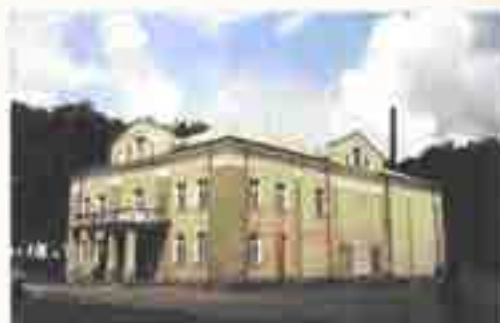
בית הכנסת במרכז בלשביץ קיים עד היום ומשמש כמועדון מקומי

בא חכם לגבולנו, כבוד ידידי שאהבה נפשי, המאור הגדול החריף ובקי, ותיק וחסיד, מו"ה שמחה יואל הכהן נ"י, אב"ד דק"ק אוסטצאי, וכתבים בידו. מחברת כלולה בהדרה בטוהר