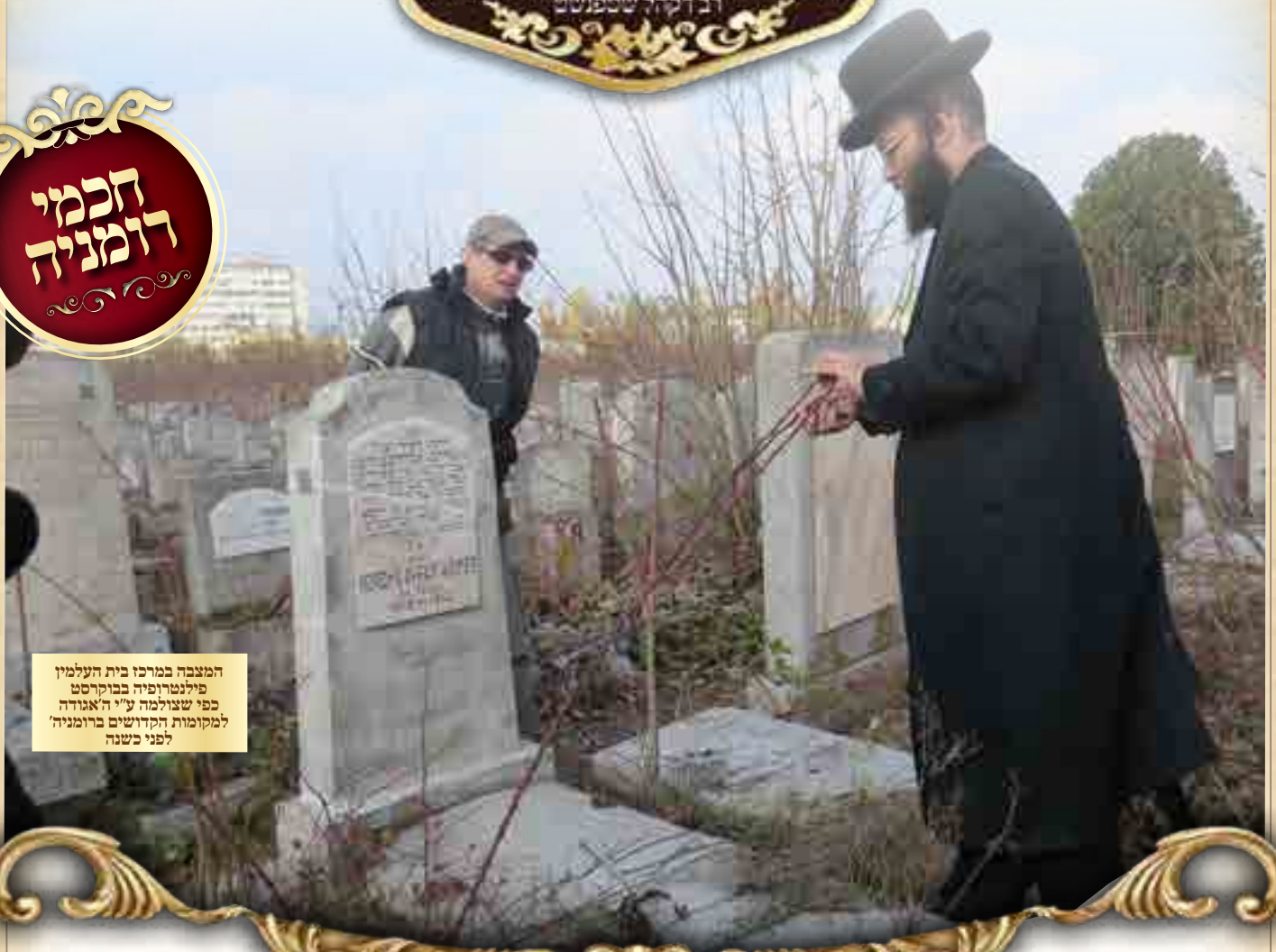
המצבה במרכז בית העלמין פילנטרופיה בבוקרסט כפי שצולמה ע"י האגודה למקומות הקדושים ברומניה לפני כשנה