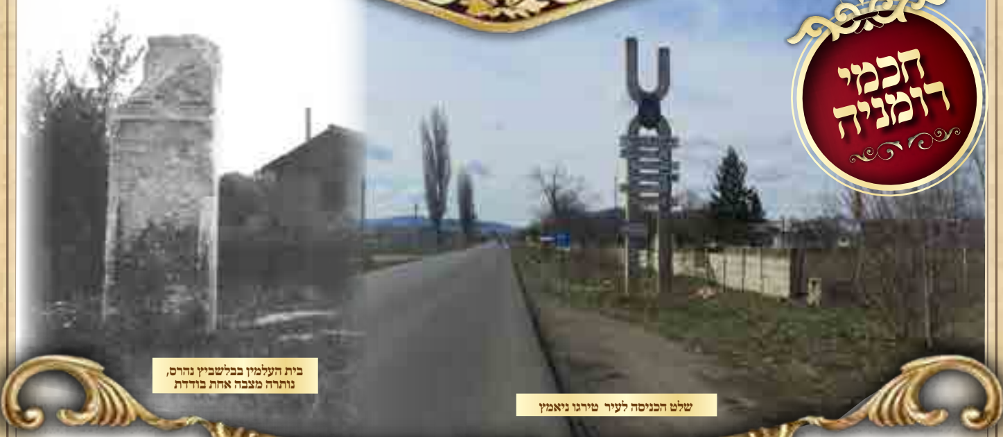
בית העלמין בבלשביץ נהרס, נותרה מצבה אחת בודדת