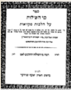
שער ספרו מי השילוח נדפס בלבוב תר"ט

על מצות הפרשת "חלה" מהלחם כתב המחבר בהקדמתו: "והנה עיקר ושורש מצוה הזאת הוא מאשר קדשנו השי"ת במצותיו ורצה בנו להיותנו נכונים בכל עת לזאת קדשנו השי"ת להיותנו עושים בכל פרטי מאכלים אחת ממצות ה' ובוזה יתעו מזונותינו להיותם עדן לנפש כמאמר הכתוב, כי לא על הלחם לבדו יחיה האדם כי על כל מוצא פי ה' יחיה האדם. מאשר ידוע פירושו מתלמידי האר"י, כמו שגשמיות המאכל זן את הגוף ככה רוחניות המאכל אשר היא חיות ה' השוכן בתוכו הוא מזון לקיום הנפש. והנה כמה מצות אשר ציוונו יתברך כזרעים לקט שכחה ופאה תרומות ומעשרות לקדש מזונותינו הגשמיים. אמנם באשר הלחם הוא עיקר מזון האם וחיותו כידוע, ציוונו ית"ש מצוה פרטיות בללחם והוא שנקדש ראשיתו ונפרישו לכוברו יתברך, ובוזה יתגלה להיותו לחם להיות מזון הנפשות, ויהיה כל הלחם נחשב שירי המצוה הזאת