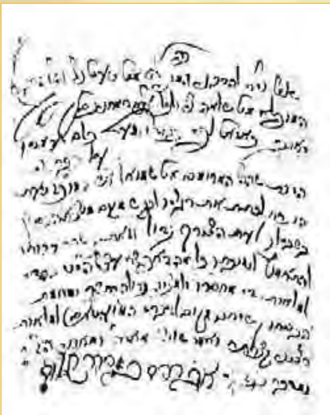
מכתב המלצה יחיד במינו התום על ידי הרה"ק רבי אברהם מפראהבישט זי"ע"א

אנציקלופדיה 'מלכות שבמלכות' לבית רוזין בהוצאת מכוננו - ח"א עמודים 68-75, 103-105, ארץ החיים, 39; אבן ישראל, עמ' י"ד-טו; בית ישראל, 9; מגדולי החסידות.