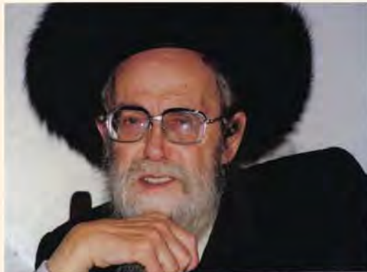
הגה"צ המשפיע רבי משה ובר זיע"א שהשבוע יחול יום ההילולא שלו

בהתלהבות כזו, עד שנדמה היה כי עוד רגע קט יתעוררו הישנים משנתם, ויצטרפו למעגל הרוקדים... לבסוף, לאחר דקות ארוכות של שירה וריקודים, עצר הרב את השירה ופנה ואמר לציבור: "בראשי התיבות של השיר ששרנו זה עתה, נמצא שמו של השם יתברך". למרות שלפי המראה החיצוני היו אלו אנשים פשוטים שאין להם השגות גדולות בשמו של השי"ת, אבל דברי הרב עוררו אותם ביתר שאת ועוז לרקוד ולשיר בהתלהבות ודבקות, פי כמה. בסביבות השעה ארבע לפנות בוקר יצאנו לדרך לכיוון ירושלים, לאחר שהבטחנו לתושבים שנחזור אליהם שוב בע"ה. ***