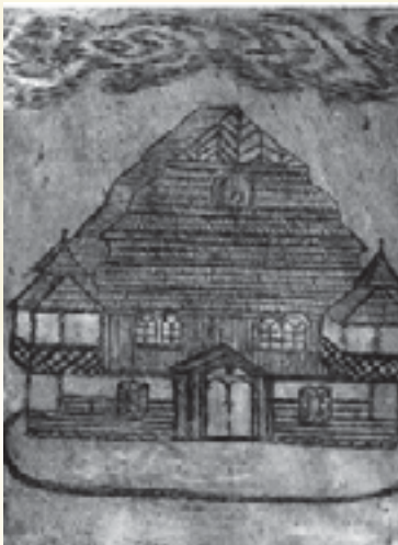
שרטוט מבנה בית הכנסת בפראהבישט