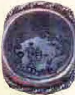
החותם בכתב ראי (גנטיים) בו מתקבלת צורת האותיות באופן קריא