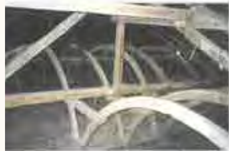
קשתות התומכים את קימורי בית הכנסת

ספרו "חלת לחם" התפרסם בין גדולי התורה ועמודי ההוראה שפלפלו רבות בדבריו, ודברו התקבלו כבסיס לפסקי הלכה בדורות שלאחריו. רבים מגדולי דורו מזכירים אותו בספרים, כדוגמת בעל הספר "מלוא העומר", ספר "פתחא זוטא". רבי משה קלירס בספרו "תורת הארץ" אסף כעמיר גורנה מדברי רבינו זצ"ל בספרו. ספרו הפך לאבן יסוד בהלכות חלה לדורו ולדורות הבאים. בתחילה הוא נפוץ מאד