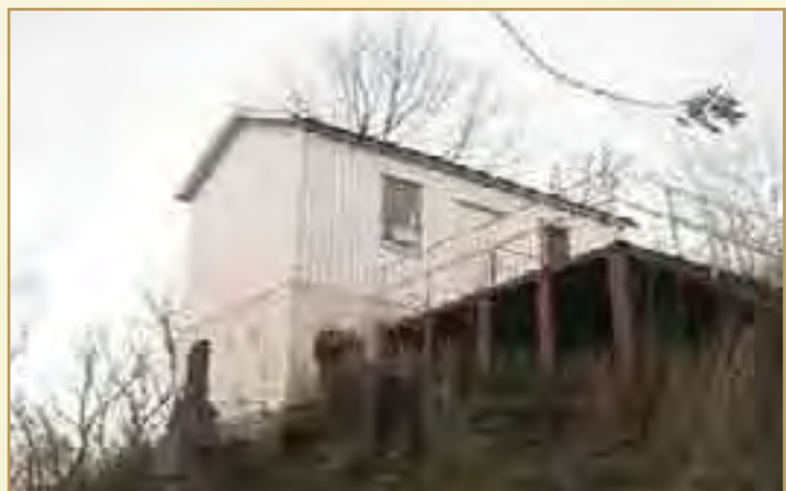
האהל בפראהבישט הנמצא במעלה ההר