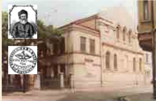
חזית בית הכנסת המלבי"ם בבוקרשט שנהרס בשנת תשמ"ה משמאל תמונת המלבי"ם והתימתו מתקופת רבנותו בבוקרשט