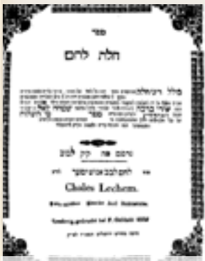
שער ספרו חלת לחם שנדפס בלבוב תרי"ג