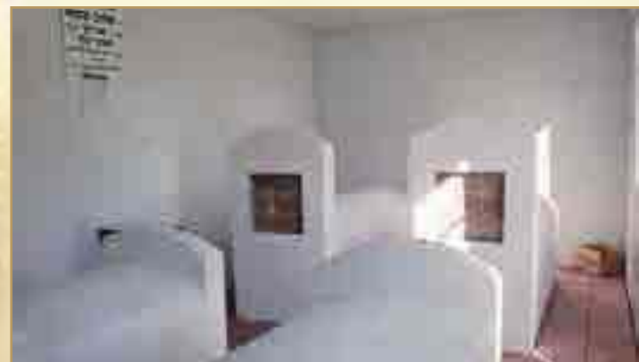
פנים האהל בפראהבישט בו טמונים הרה"ק רבי שלום מפראהבישט ושני בניו הרה"ק רבי אברהם ורבי דוב בער זצ"ל לצד זוגתו הרבנית ע"ה

בנו השלישי של הרה"ק רבי שלום מפראהבישט היה רבי דב בער כמעט ולא נותרו בידנו פרטים אודותיו זולת מעשה אחד מתקופת היותו בברית האירוסין, וגם זה נראה שהיה בהיותו עול לימים יתכן ואף לפני גיל הבר מצווה של הרה"ק רבי לוי יצחק מברדיטשוב [אחת משני בנותיו שהיו לו], בהיותו בן י"ב שנה נחלה מאד, ובא אליו מחותנו הרה"ק רבי לוי יצחק לבקרו, וכאשר ראה את מצבו הקשה, אמר לו שיגיד לו איזה המלצה ולימוד זכות על ישראל, ובאותו מעמד אמר את התורה דלהלן, נפטר ב"ז אדר (השנה לא ידועה לנו), ומנו"כ באהל קבורת אביו ואחיו שבבית העלמין דעיר פראהבישט.