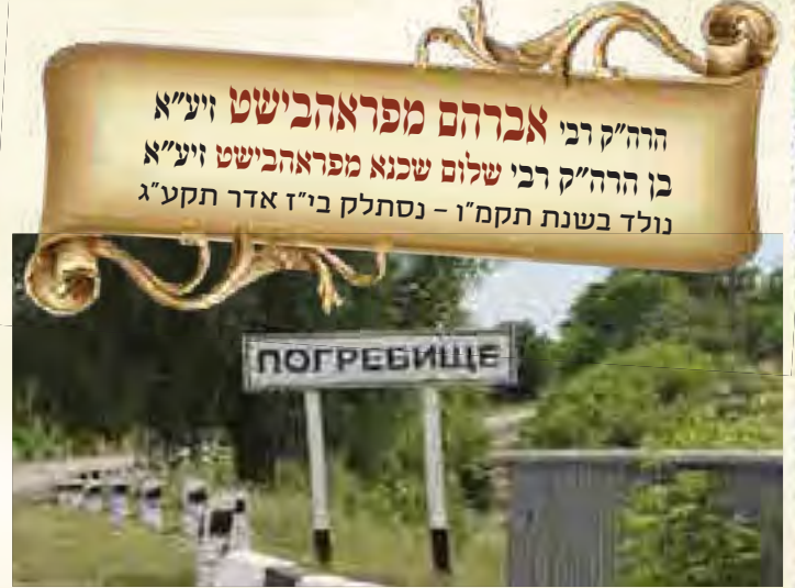
שער הכניסה לעיר בארדיטשוב

הרה"ק רבי אברהם מפראהבישט זיע"א בן הרה"ק רבי שלום שכנא מפראהבישט זיע"א נולד בשנת תקמ"ו - נסתלק ב"ז אדר תקע"ג