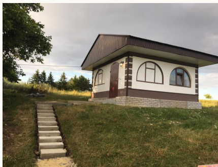
האהל של קברו של רבינו במעלה ההר בבית העלמין ביאגלניצא