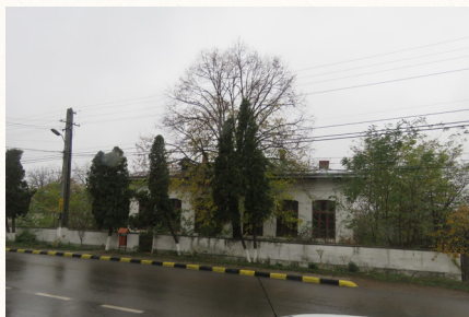
הת' היהודי 'שקוואלה יוראליטה' בשטפנשט המבנה קיים עד היום ותמונה זו צולמה לאחרונה המבנה רחב ידים ובוהו ומרשים במיוחד ולו חצר ענקית מאחוריו, זהו הבנין היהודי היחיד שנותר קודשו כיום בעיר שטפנשט

וחיים יצא מהטרקלין כשליבו מלא שמחה והוא מודה להקב"ה על רוב הצלחתו והסיעתא דשמיא שהייתה