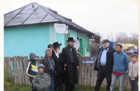
רחוב הצדיק בעיירה שטפנשט ברומניה