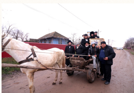
כמעטים ימימה חסידיים על סוס ועגלה בנסיעה לצדיק בעיר שטפנשט

חיים הביע על אתר את הסכמתו כשהוא מציין לעצמו ציון לשבח איך שבהבעת פנים מעושה הצליח להוריד לחצי את סכום הערבות הנדרשת. מיד נשלפה הניירת המתאימה, ההסכמים והערבויות נוסחו בקפדנות,