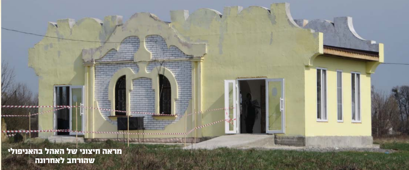
מראה חיצוני של האהל בהאניפולי שהורחב לאחרונה