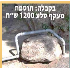
בקבלה: תוספת מעקה סלע 1200 ש"ח

אחד טעה באפריקה, ופוגע בשבט של אפריקנים. הוא פונה לראש השבט ומנסה בזהירות לברר: "האם יש אצלכם קניבלים?" ראש השבט מניף את מקלו בתנועת ביטול; "לא, אל תדאג, אכלנו אתמול את האחרון..."