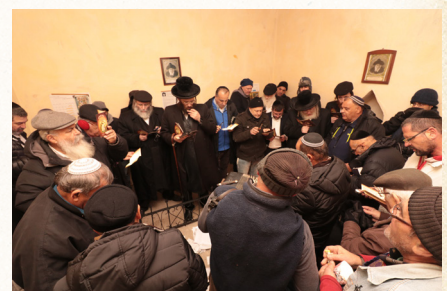
תפילות בבית העלמין שטפנשט באהל שהיה מנוחת קברו של הצדיק משטפנשט בטרם הועבר לארה"ק בשנת תשכ"ט