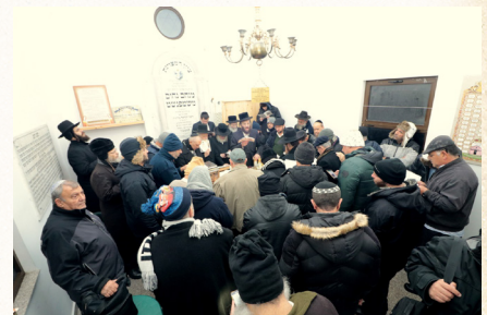
משתתפי מסע ההילולא של הצדיק משטפנשט מתפללים בציון בעל ההילולא ביאס