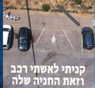
קניתי לאשתי רכב וזאת החניה שלה