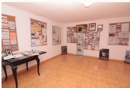
מזוויאון לתולדות בית שטפנשט שהוקם בכניסה לבית העלמון בעיר שטפנשט