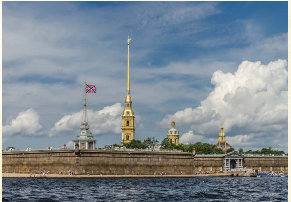
מבצר פטרופבלובסקיה בו היה אסור הרה"ק בעל התניא

רדיפות אלו לא פסחו על אחד מן המיוחדים מבני היכלא קדישא של הרה"ק ממעזריטש זי"ע, הלא הוא הרה"ק רבי שניאור זלמן מלאדי זי"ע בעל התניא ושו"ע הרב, והגדילו לעשות מבקשי נפשו עת אשר העלילו עליו