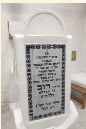
מצבת הרה"ק המגיד ממעזריטש זי"ע"א