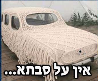
אין על סבתא...

חבר אמת זה אחד שיעשה לך קפה בכוס חד פעמית