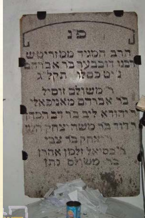
המצבה הישנה שהייתה על ציוני הצדיקים בהאניפולי

הקב"ה מעניש על מעשה החטא בלבד ולא על מה שנגרם מכך "ולך ה' חסד כי אתה תשלם לאיש כמעשהו" (תהלים מב יג)