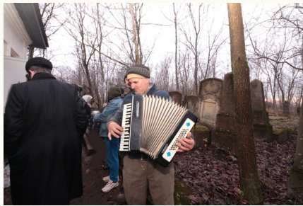
הזמורת מקומית בעיירה שטפנשט מקדמת בברכה את השבים לשטפנשט בעת המסע שנערך על ידי מוסדות שטפנשט בהילולת האדמו"ר הראשון