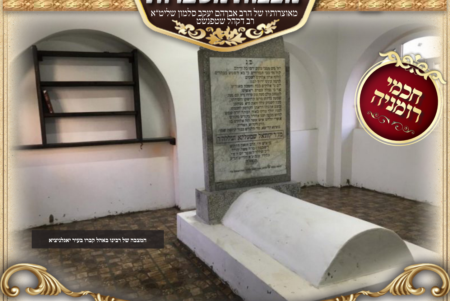
המצבה של רבינו באהל קברו בעיר יאגלניצ'א