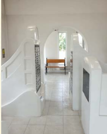
ציוני הצדיקים בהאניפולי הרה"ק המגיד ממעזריטש זי"ע"א והרה"ק רבי זושא מהאניפולי זי"ע"א