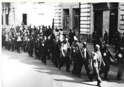
יהודי מוגילוב מגורשים מביתם