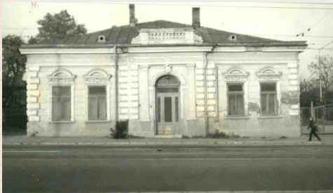
בנין הקלוז ברחוב הילנה דואמנה שנהרס