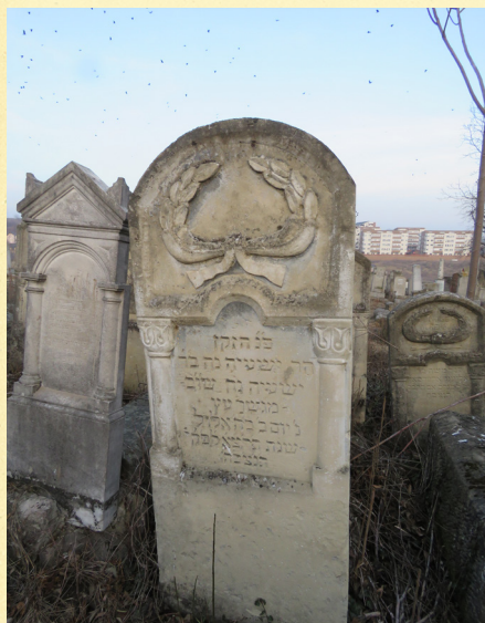
מצבת רבי ישעיה נח בן רבי ישעיה נח שו"ב 'גשר אדום'