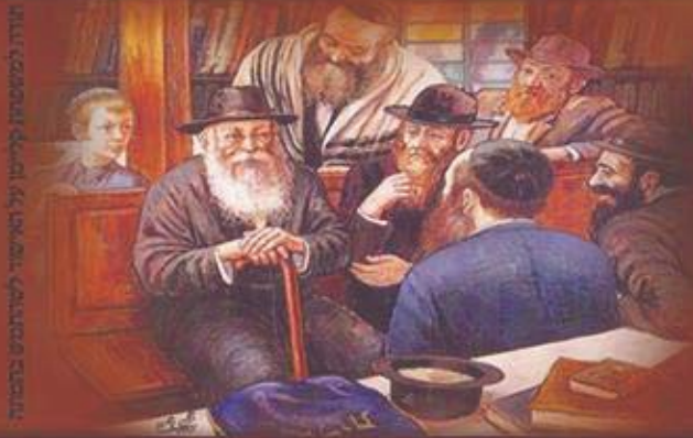
תורה למשפחה לקיים על האישיר לפרשת במדבר