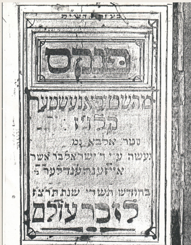
שער הפנקס של השטעפינעשטער קלוז ברחוב 'אלבה' מתשרי תרצ"ו ובו פרטים עשירים ביותר מוזי הקלוז פרוטים על גבי 506 עמודים מרתקים