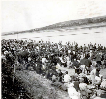
גירוש יהודי מוגילוב לטרנסניסטריה בתמונה נראים היהודים על שפת הנייסטר