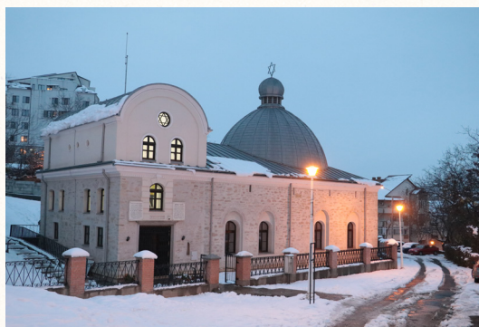
בית הכנסת ה'שילהויף' בו התפלל וכיהן הרה"ק מאפטא, בית הכנסת קיים ופעיל עד היום במרכז יאס