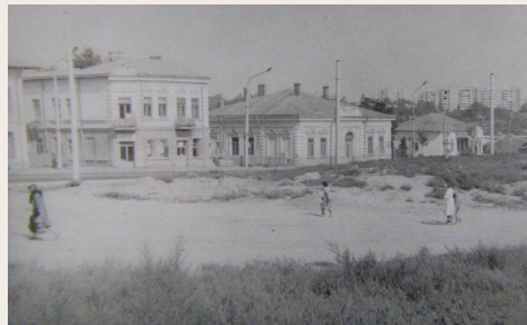
מראה כללי של רחוב הילנה דואמנה בן נראה הקלוז במרכז הבנינים שמסביב לו