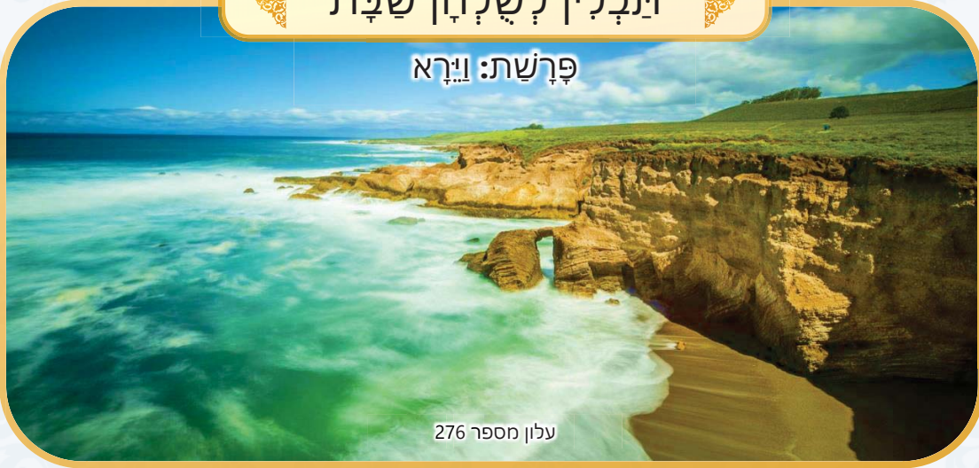
עלון מספר 276

נא לא לקרוא בשעת התפילה וקריאת התורה. העלון טעון גניזה. הלימוד בשבת פי אלף מיום חול. כדאי לקרוא בשלחן שבת.