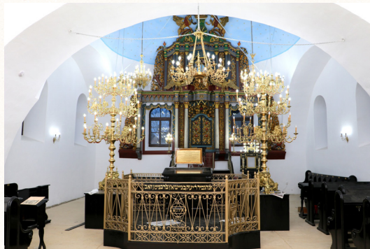
מראה כללי של פנים בית הכנסת ה'שילהויף' כפי שנראה כיום