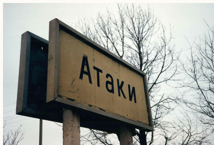
שלט הכניסה לכפר אטקי

הבלבול שלט בכלום ואף לא אחד ידע לאן אנו נוסעים ולהיכן אנו אמורים להגיע בסוף המסע שיצא זה עתה לדרך העלומה. נסענו משך ליל שבת וביום השבת עם שתי הפסקות במהלך הנסיעה. הפסקה אחת היתה בשבת בבוקר בטשערנוביץ למשך שעה אחת, ואני זוכר שכשיהודי אחד מנסועי הרכבת העז לבקש מים, כיוון אליו אחד החיילים את רובהו דרך החלון, והרמז היה מובן מאליי שכאן צריך לשתוק