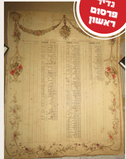
מסמך היסטורי מהשטעפינעשטער קלוז בגשר אדום ביאסי רשימת קל"ח תורמים לקלוז בשנים תרס"ה-1

הבתולה הצדיקת זו היתה בעלת רוח הקודש וידעה ללמוד תלמוד שלחן ערוך ופוסקים, וכל צדיקי הדור העידו עליה שהיא בעלת נשמה גדולה עד מאוד, ובסוף פעלו הצדיקים שתנשא לאיש ופסקה ממנה רוח הקודש ועלתה לא"י. ר' דוד ישב ביאס לערך שלשים שנה ונפטר כ"ד תמוז תרמ"ג.